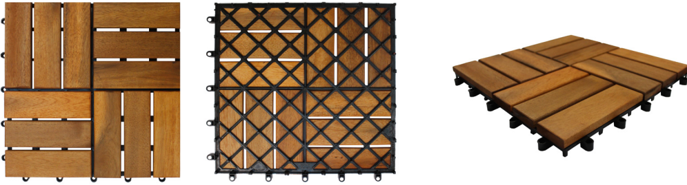
Oiled acacia deck tile with interlocking plastic base.